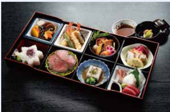
H-01 箱会席 (料理7種・ごはん入) 炊合せ/天ぷら/焼物/酢物/ローストビーフ/ 練り物/お造り3種/ごはん/吸物 6,000円(税込) 5,555円(税別)