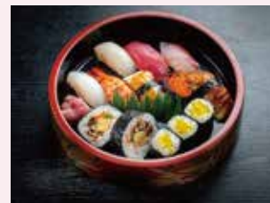
にぎりと巻き物盛合せ (にぎり8貫、細巻3貫、太巻2貫) ※折詰めもございます。 3,350円(税込)~ 3,102円(税別)

多恵のお寿司は ネタの鮮度にこだわります。 にぎり、巻物、盛合せ等、 お好みに応じて調製致します。