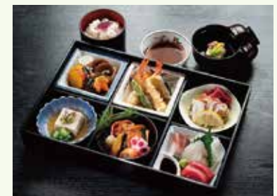
S-03 松花堂弁当 (料理6種・ごはん付) 炊合せ/天ぷら/酢物/ 練り物/焼物/お造り3種/ ごはん/吸物 5,200円(税込) 4,815円(税別)

・箱会席 変更OK! ※事前に ・松花堂弁当 お申し付けください ◆白ごはん +300円で → ちらし寿司・ 赤飯・巻き寿司 ◆吸物 +350円で → 茶碗蒸し