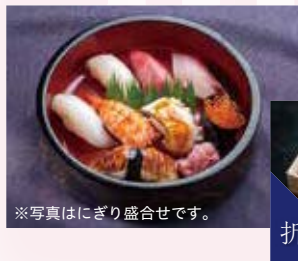
にぎり盛合せ(8貫) 2,700円(税込) 2,500円(税別) 上にぎり盛合せ(8貫) 3,800円(税込) 3,519円(税別)