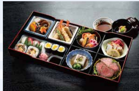
H-02 箱会席 (料理6種・寿司盛合せ入) 炊合せ/天ぷら/焼物/酢物/ローストビーフ/ 練り物/寿司盛合せ(にぎり4貫、上巻2貫、 細巻3貫)/吸物 6,300円(税込) 5,833円(税別)

お箱にまとめた 会席料理です。 その見た目の豪華さと 料理の内容にご満足 頂けると思います。 ※すべて吸物付