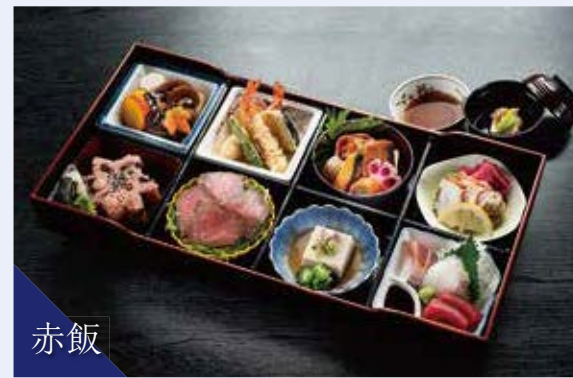
H-01 箱会席 (料理7種・赤飯入) 炊合せ/天ぷら/焼物/酢物/ローストビーフ/ 練り物/お造り3種/赤飯/吸物 6,300円(税込) 5,833円(税別)