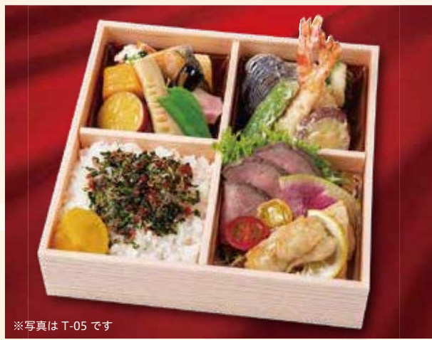
※写真は T-05 です

白ごはん +300円で → ちらし寿司・赤飯・うなぎごはん 変更OK! +500円で → 巻き寿司