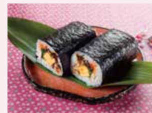
上巻き寿司(1本) 1,600円(税込) 1,481円(税別)