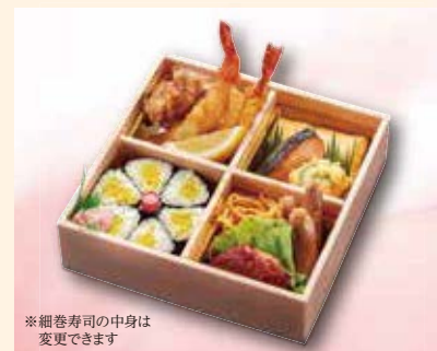
※細巻寿司の中身は変更できます

T-09 彩り多恵弁当 3,400円(税込) ちらしとお造り入 3,148円(税別) 煮物と焼物/天ぷら/お造り3種/ちらし寿司 W21.5×D21.5×H5.5(cm)