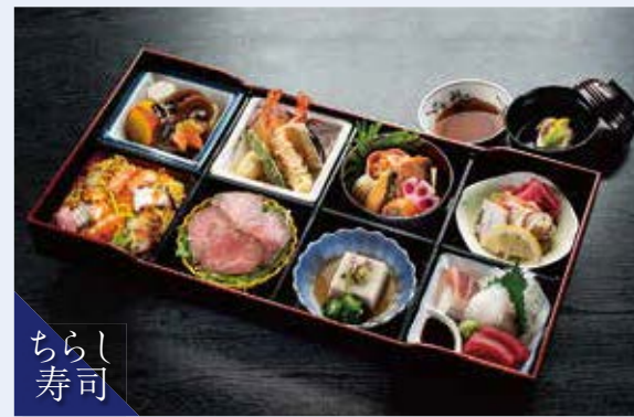
H-01 箱会席 (料理7種・ちらし入) 炊合せ/天ぷら/焼物/酢物/ローストビーフ/ 練り物/お造り3種/ちらし寿司/吸物 6,300円(税込) 5,833円(税別)