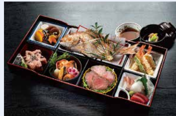
H-03 箱会席 (料理5種・祝い鯛・赤飯入) 炊合せ/天ぷら/焼物/ローストビーフ/ お造り3種/祝い鯛/赤飯/吸物 7,500円(税込) 6,944円(税別)