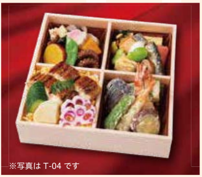
※写真は T-04 です

T-05 彩り多恵弁当ローストビーフ入 2,700円(税込) 煮物と焼物/天ぷら/ローストビーフ/ごはん 2,500円(税別) W21.5×D21.5×H5.5(cm) T-06 彩り多恵弁当お造り入 3,100円(税込) 煮物と焼物/天ぷら/お造り3種/ごはん 2,870円(税別) W21.5×D21.5×H5.5(cm)