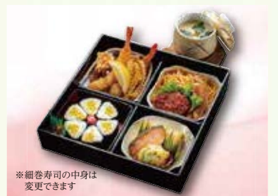
SK-03 お子様用松花堂弁当 (料理3種・細巻入・茶碗蒸し付) 出し巻/ハンバーグ/ エビフライ/とり唐揚/ ソーセージ/細巻寿司/ 茶碗蒸し 2,200円(税込) 2,037円(税別)