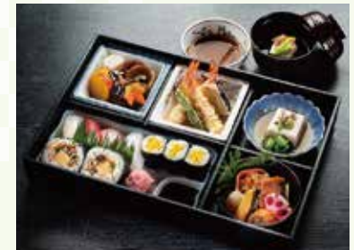
LS-02 松花堂弁当 (料理4種・寿司盛合せ入) 炊合せ/天ぷら/練り物/ 焼物/寿司盛合せ(にぎり 4貫、上巻2貫、細巻3貫)/ 吸物 4,700円(税込) 4,351円(税別)