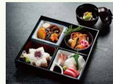
S-01 松花堂弁当 (料理3種・ごはん付) 炊合せ/焼物/ お造り3種/ ごはん/吸物 3,400円(税込) 3,148円(税別)